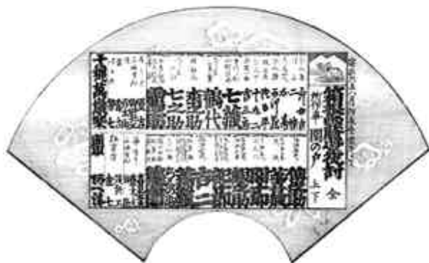
安政6年8月 愛宕町芝居(絵番付)

第二回配本となる本巻は、春日山芝居・卯辰芝居座・卯辰八幡社芝居・卯辰多聞天社芝居・愛宕町芝居・十一屋芝居・元車芝居・犀川馬場先芝居・鍛冶町八幡社芝居・西新地芝居・東新地芝居・西御影町芝居(大國座)・卯辰末吉社芝居を収録しています。