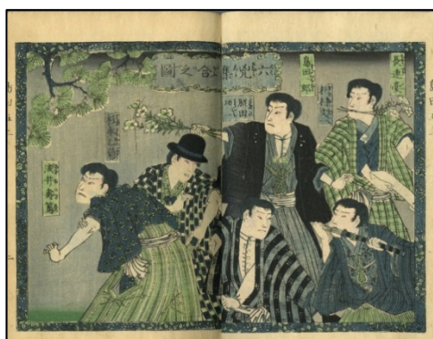
「島田一郎梅雨日記」初編 岡本 起泉 綴 芳川 春濤 閱 歌川/房種 画 島鮮堂 1879