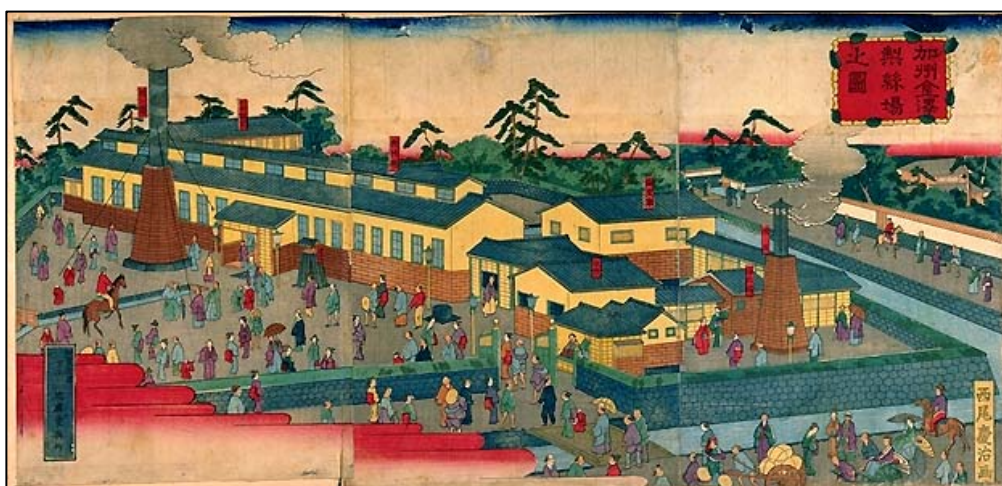
「加州金沢製糸場之図」 西尾 慶治 画 近広堂与作 (金沢) 明治年間