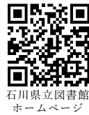
石川県立図書館 ホームページ