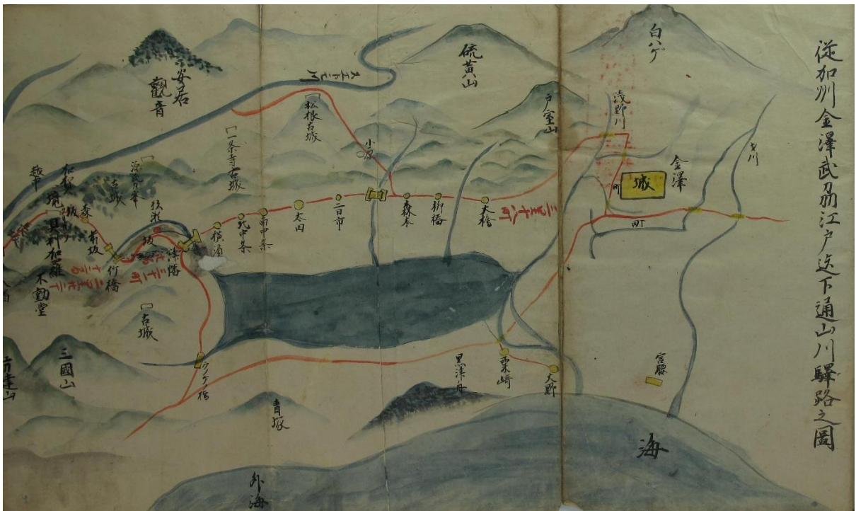
『從加陽金沢至武州江戸道中記』

【期間】平成 29 年 11 月 1 日 (水) ~ 12 月 27 日 (水)